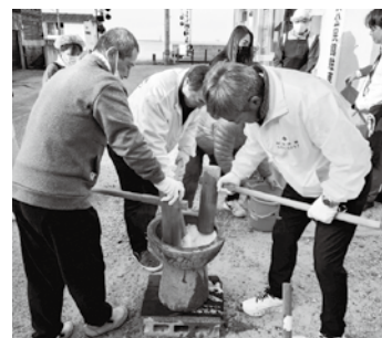
中嶋前会長、中野第一副会長が餅をこねています。これが一番大事な工程です。