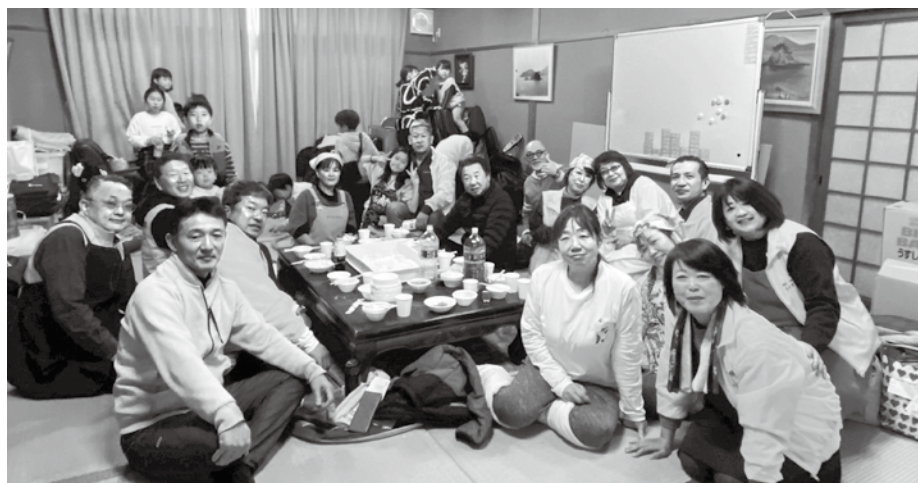
最後は参加者とおいしいお餅を食べてハイ！チーズ！