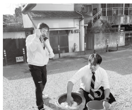
杵でつく人をつき手といい、臼で取る人を返し手といいます。