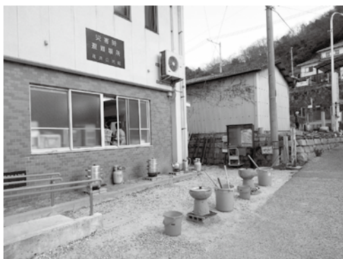
近所の子供達もワクワク