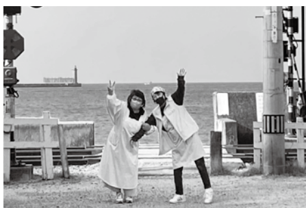
池之内新入会員と楽しく戯れる徳居会員