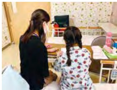
③長期入院している子供達を勉強の面でもサポートします。愛大の学生さん達が協力します。