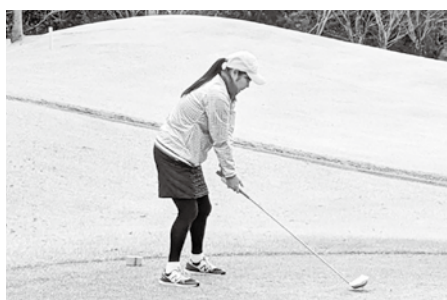
⑤俊成会員、ドライバー当たってますか!?