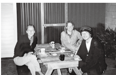
若かりし頃、ニュージーランドを自転車で旅行する挑戦をされたそうです。