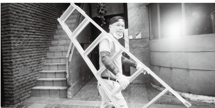
③門田害虫研究所を設立して7年。この業界では20年近い経験があるそうです。