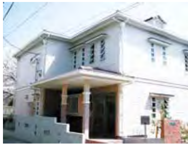
②ラ・ファミリエが運営するファミリーハウス あい。入院や、通院のため遠方から来られる家族の為に宿泊施設です。長期入院は家族にとって金銭的にも大きな負担です。ここは1300円で泊まれます。