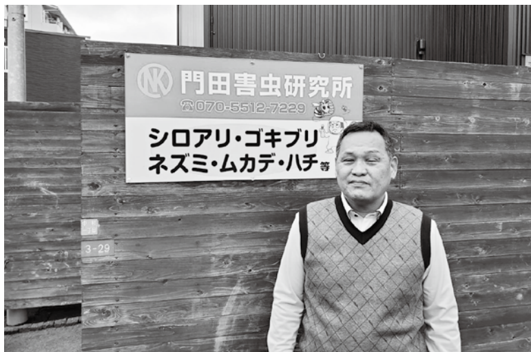
②お仕事は害虫駆除を中心にやられています。シロアリ、クロアリ、ゴキブリ、ネズミなんでもござれとの事です。