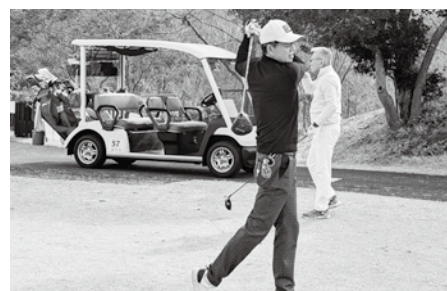
③我らのM委員長、ドラコンの旗を立てるのを忘れてますよ。