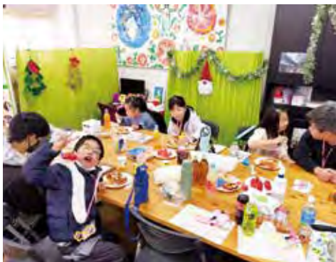
④子供達のクリスマス会の写真です。ラ・ファミリエは子供たちが自分の病気のことをしっかり説明できて、自分のやれることを主張できることが自立することと考えております。