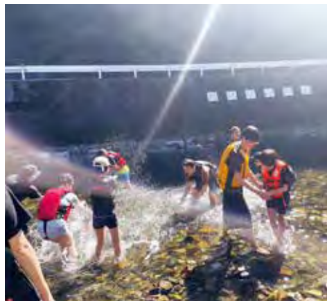
⑤四万十川でのお泊まり会も行っており、子供達も安心して遊ぶことができます。