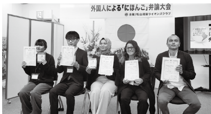
受賞された皆さん