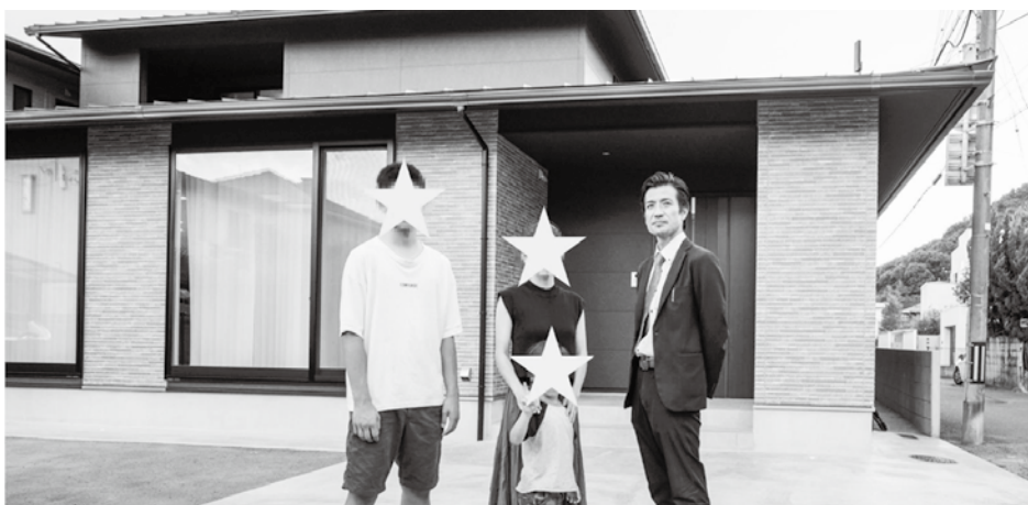
奥様と子供2人の4人家族。最近、家も建てられました。

趣味はゴルフ、サーフィン、夫婦でのランニング。なんと今年はトライアスロンに挑戦されました。