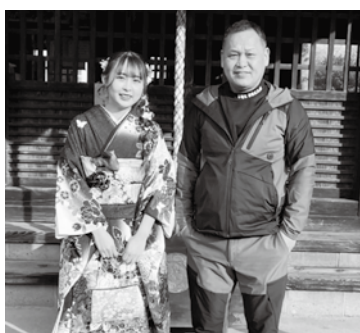
⑥結婚して25年。お子様2人の4人家族。今年お嬢様が成人されました。