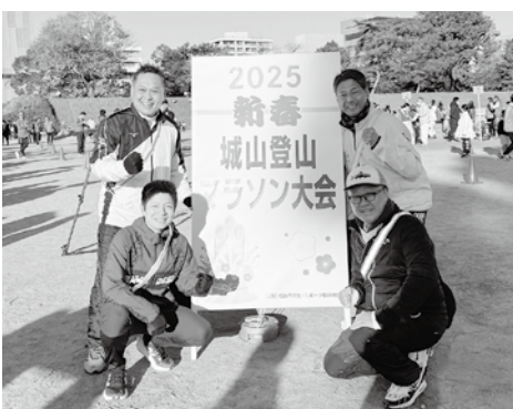
⑤趣味はマラソン。今年は新春の城山マラソン大会にも参加されました。