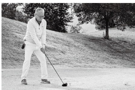
④何と優勝🏆は、笹岡会員で一す♥