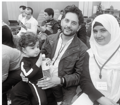
ご夫婦で参加して頂きました 赤ちゃんの可愛いさがもう最強です！