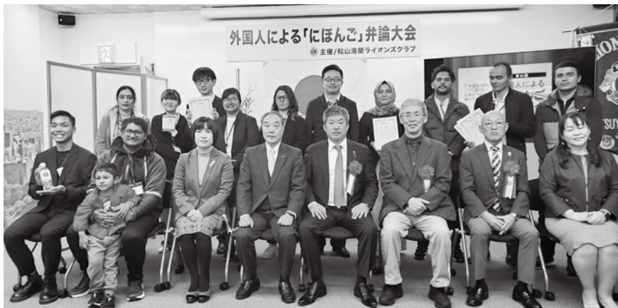
弁論者の皆さん、審査員の方々と集合写真 皆さん素晴らしいスピーチありがとうございました。