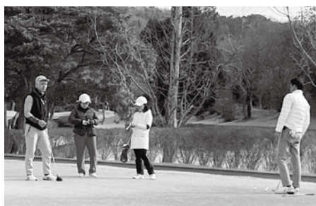
②第二副会長楽しそう♥