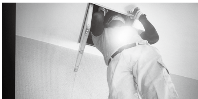
④ネズミ等は出入口を探しふさがります。侵入を防ぐことが必要とのこと。でも1番の策は掃除をすることだそうです。