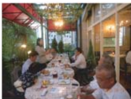
●担当委員会による、懇話会のようす。席上、新会員による入会挨拶も行われ、ホテルのテラス会食は、和気あいあいのうちに進行した。

会員一人一人、事業に興味を持ち、ハード面、ソフト面お互いにより良いクラブ育成に協力して行きましょう。