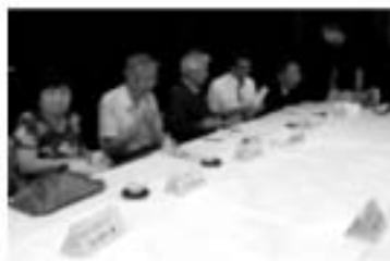
熱心な議論がつづく、委員長スタイルのようす。

標記、委員長スクールが開講されました。今回は委員長の代理として出席いたしましたが、主なテーマとしましては、●東北震災被災地への救援の件。今回、この災害に関して反省点がたくさんあり、336A地区は、日本赤十字社4県支部と『災害時における、救援物資調達にかかわる協定書』の締結に向け、調整をすすめているところで、被災地に向けての救援物資が、円滑に供給されるようにするための目的のものです。各クラブあてに、アンケート配布があるそうなので、その時点で、供給出来る物資の明細記入と、リストの返信をお願いしたいとの事でした。