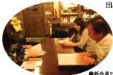
●新会員2名が参加した、ライオンズクラブについての懇話会。

■会長スローガン「原点に戻ってウィサーブ」をもとに、マンネリ化状態を少しでも改善の方向にもってゆく事。それには、新入会員、スポンサー、現会員とのコミュニケーションをより強く持ち、とかく出席率の悪い会員には、一声運動を起し、対話と連帯感を全会員に植えつつ、楽しいクラブ運営をはかれば、ドロップも少しは防げるのではないのでしょうか？