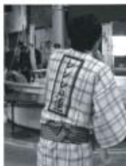
数ある「連」の中の一つ。

来年はみなさんも、真夏の祭典「阿波踊り」で、「THE日本の夏」を感じてみてはいかがでしょうか。