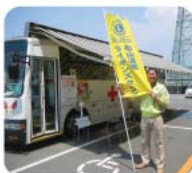
●当クラブのペナントで、献血を呼びかける。