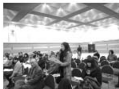
【写真】前回の会場風景。主催者に賛同する、聴講者の代表。