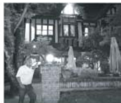
イタリア料理店・スカルピオーネの前で。

広大な土地にあるので、敷地内はバスでの移動。ちなみにバスは30人乗り位の大型で、一人での移動でもそのバスが来るので恐縮します。最初から最後まで、松山にはない雰囲気連続でした。いつか、純粋に観光で行ってみたい場所です。皆様も、是非行ってみてください。避暑には最高です。